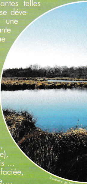
Tourbière de Lande Marais